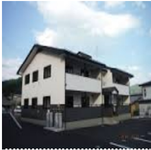
住まい再建こそ復興の証