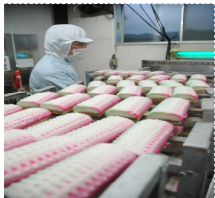
かまぼこの生産＝鈴廣かまぼこ店