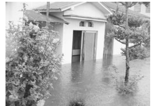
床上浸水した家屋

調査を踏まえて、国や県にも支援を要望。国の激甚災害指定を農地だけでなく公共土木事業にも適用させました。町議会でも、農作物被害への救済、治水対策の強化を求め、支援を中途半端に終わらせないよう、町の姿勢をただしました。