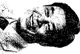
〇岸土 日本共産党衆議院国会対策委員長 こくた 穀田恵二