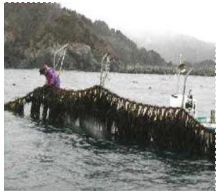
海水温の高さによる影響が

養殖ワカメの収穫が最盛期を迎えています。海水温が7~8℃と異常に高くその影響を心配する声は浜からあがっています。例年3月は3~5℃台なのに7~8℃台に