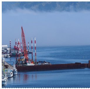
難航する開伊川水門工事