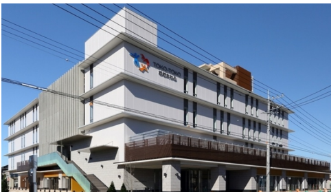
市街地活性化を担う大田原市子ども未来館

【問】閉伊川水門の受入は市長の苦渋の決断だったと考えるが、市長の判断には瑕疵があったの