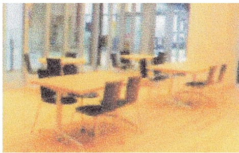
イーストピア2階に予定のカフェコーナー

「同フェア」は5月末時点で社会福祉法人の若竹会、翔友などが会員になっており、委託により市は障害者の就労機会の確保とともに就労訓練を促進させ、市民との交流を通じて、障害者への理解を進めるのが目的で、委託費は今年の当初予算に37万4千円(半年分)が計上されています。「同カフェ」は計画時