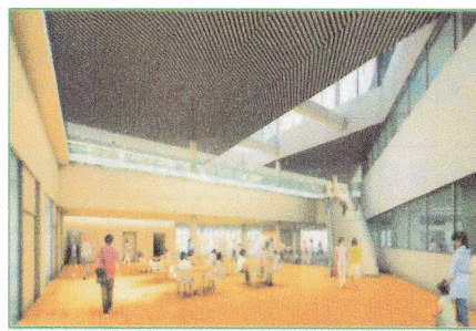
交流プラザの完成イメージ(1階)

市によると同センターは「学び・交流する」以外に災害時の一時避難施設機能を持ち、賑わいのあるまちづくりが目的です。使用料は受益者負担などを原則に市内類似施設の利用に影響を与えない額を基本に免除も可能としています。特徴は時間貸出を1時間単位に料金には冷暖房料も含むとしていることです。貸部屋は会議室、創作