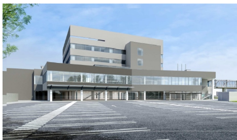
間もなく1年を迎える議会議場を含む新庁舎

11日、市議会9月定例会議に18年度一般会計決算や国保会計など特別会計決算の認定議案および19年度各会計の補正予算、条例など計45議案が提案されました。議案はいずれも各常任委員会に付託されました。