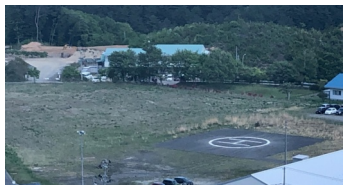
はまゆり学園の移転候補地(佐原)

【議長】受け止め方はしていると記憶しています。民設民営という流れの中で不明なところをしっかりと見極め、それがクリアできなければ、白紙ということもあり得ると私は思います。