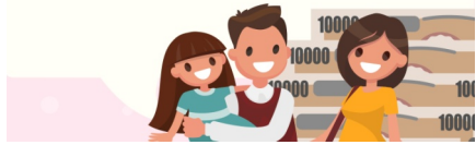
特別定額給付金の利用を知らせるチラシ

宮古市は市独自の事業継続給付金(20万円)等市独自の支援策の支給を優先させたのも原因と思われる。